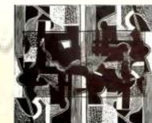
Linolschnitt 40 X 50 cm (1981)

Hochschule Gyula Juhász in Szeged Diplom - Biologie - Bildende Kunst Technologin für Schulung